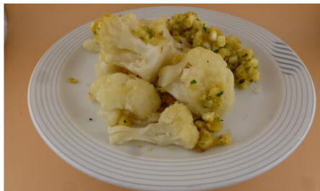
BLUMENKOHL MIT EI