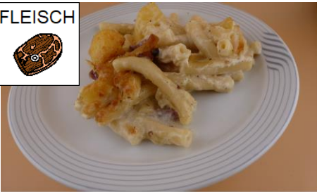
ÄLPLERMAKKARONI MIT SPECK