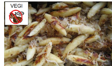
SCHUPFNUDELN UND KRAUT