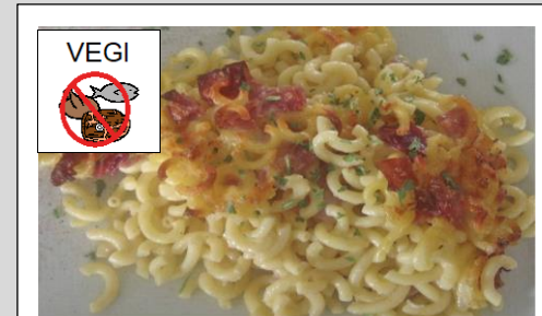
HÖRNLI - AUFLAUF