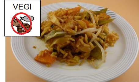
NASI GORENG MIT TOFU